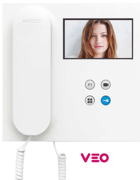
Dimensiones: 200x 200x23 mm (44 incluyendo auricular)