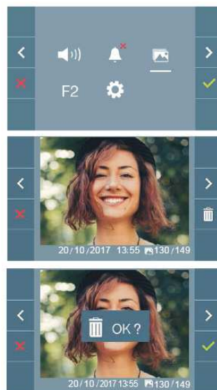
Captura automática de fotos (PHOTOCALLER)