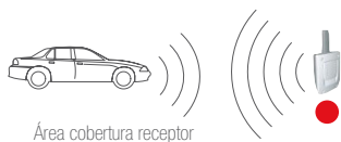
Área cobertura receptor