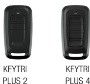
KEYTRI PLUS 2