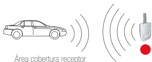
Área cobertura receptor